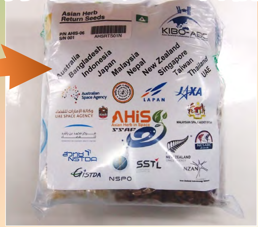
全ての種子は1つの大きなジップロックバッグに梱包され、準備完了！