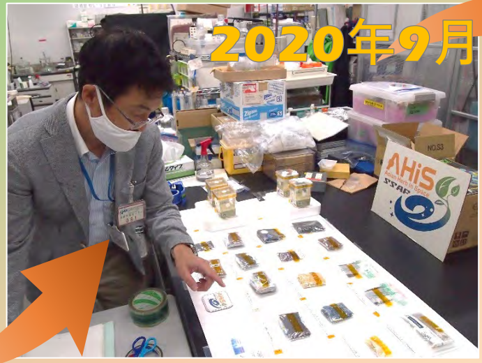
植物防疫所職員による種子の検疫検査